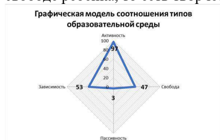
Рис. 1. Модель текущего состояния среды организации

Таким образом, можно сделать вывод, что особенностью образовательной среды школы является выраженная «карьерная» среда. Важно обратить внимание на недостатки образовательной среды и создать условия, которые бы способствовали активности и свободе ребенка, то есть творческой атмосфере.