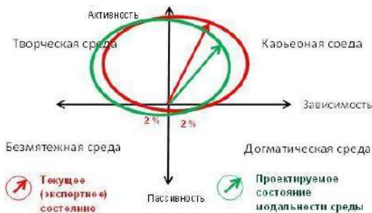
Рис.2. Модель проектируемого состояния среды организации

Можно сказать, что проектируемое состояние стремится к «творческой» среде, формирующей более свободного и активного ребенка. Важной задачей является изменение модальности в сторону творческой среды.