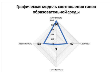
Рис.1. Модель текущего состояния среды организации